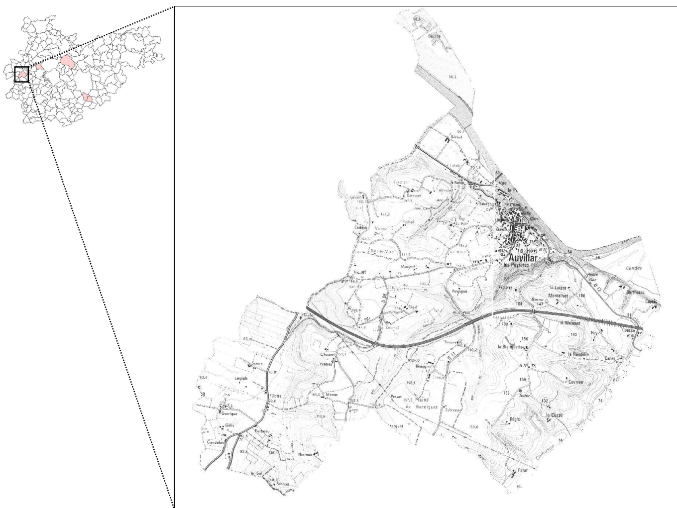
Figure 1 : Situation géographique

La situation géographique de la commune est précisée sur l'extrait de carte suivant.